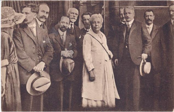
Annie Besant in Antwerpen

De praktijk van de theosofie is daarmee in overeenstemming.