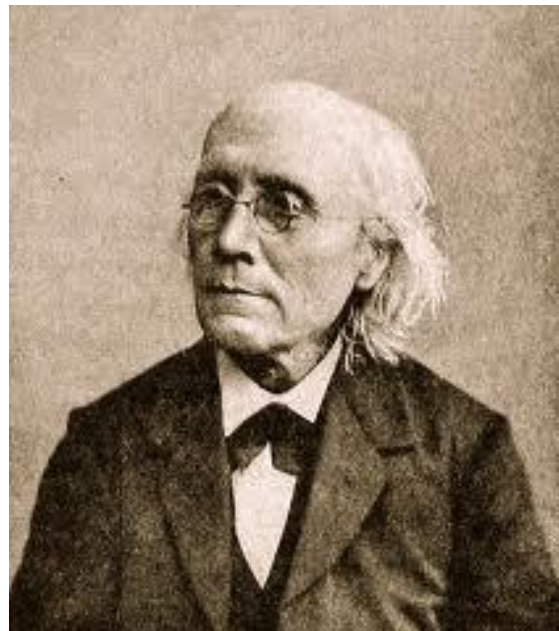
Gustav Theodor Fechner

die in 1918 werd opgericht "met het doel de geestelijke stromingen van dezen tijd, die, ieder op eigen manier, de broederschap onder de mensen trachten te bevorderen, met elkaar in contact te brengen, opdat ze elkaar beter leeren waardeeren en zooveel mogelijk samenwerken voor het bereiken van haar gemeenschappelijke doel. (...)alle mensen als broeders te beschouwen en er naar te streven ons denken, voelen en handelen daarmee in overeenstemming te brengen."